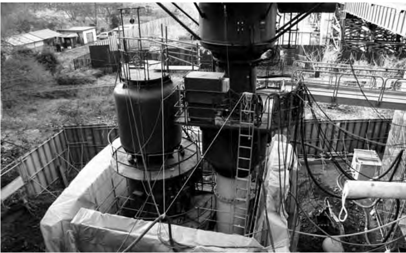
写真4 ●ニューマチックケーソンによる施工の様相

首都圏の広域幹線道路網を形成し、首都圏の道路交通の円滑化、環境改善、沿線都市間の連絡強化、災害時の代替路としての機能など、多くの役割を担っている。