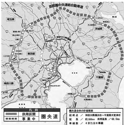
図表1 ● 工事位置図

また、搬出入口と上段構台間の直下には、明治期に完成したレンガ造りのJR中央本線・湯の花トンネルがある。そのため、内空変位計測システムによる監視体制を整えている。