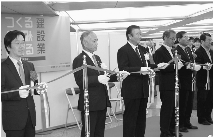
オープニングセレモニー（左から3番目／水島会長）

また、会期中は、3日間で12,000人と、大変多くの方々に来場いただき、「災害の対策などに前向きに取り組んでくれていることが感じられてよかったです」などの感想をいただきました。