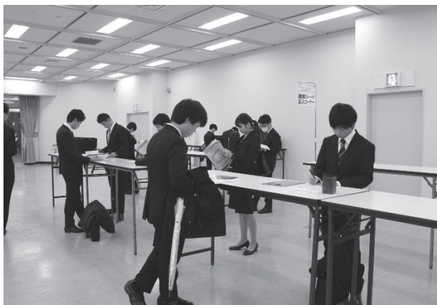
「出会いのカード」に記入をする学生。