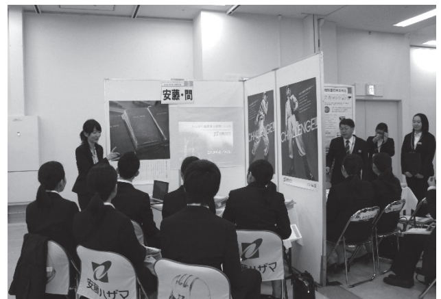
少人数制のため、一人ひとりとの距離が近い。